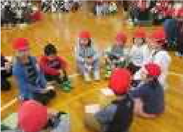
刈羽小学校では、清掃や運動会を異学年の子どもたちでつくるファミリー班で行っています。その初めての顔合わせ会を行いました。(4月15日)

新しい先生と新しい友達を迎えて、平成31年度の学校生活が始まりました。総勢242名でのスタートです。