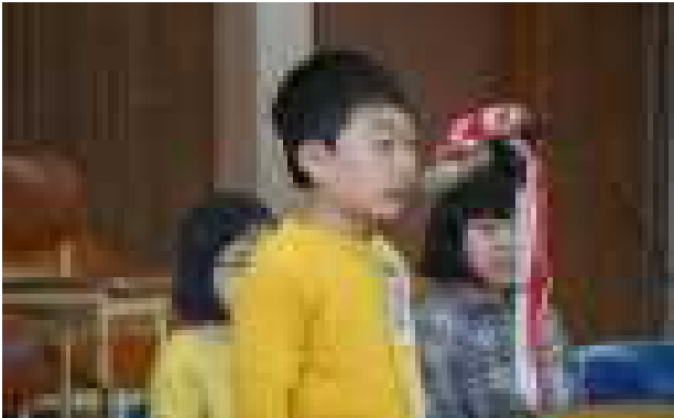
始業式で1学期のめあてを、大きな声で堂々と発表しました。(4月5日)