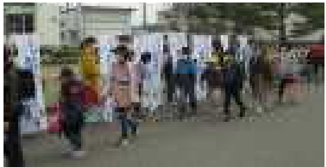
生活委員会の子どもたちが並んで、元気なあいさつが響いた「全村あいさつ運動」です。(4月12日)