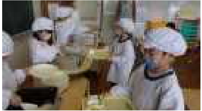
1年生の給食が始まりました。初めての給食はハヤシライスでした。給食当番の仕事をがんばってやりました。(4月11日)

新しい先生と新しい友達を迎えて、平成31年度の学校生活が始まりました。総勢242名でのスタートです。