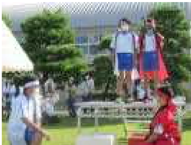
刈羽小学校大運動会 開会式(誓いのことば)