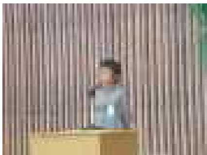
前期に頑張ったこと