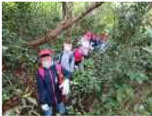
5年生自然教室 ストレートハイク

刈羽小学校の校庭では桜の葉が色づき、妙高山では初冠雪が観測されたというニュースが届き、秋の深まりを感じる季節となりました。