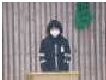
後期に頑張ること