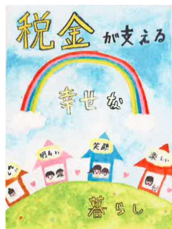
武本乃娃さんの作品