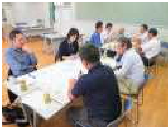
第3回学校運営協議会（グループワーク）

村内にハクチョウが飛来し、秋の深まりを感じる季節となりました。刈羽小学校では、10月1日(火)に校内マラソン大会を、10月19日(土)に刈羽小学校文化祭をそれぞれ実施し、「スポーツの秋」「芸術の秋」を子供たちも実感しています。