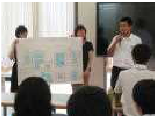
第2回学校運営協議会（グループワークの発表）