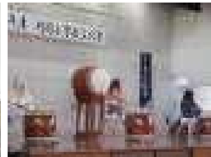
日本海太鼓の太鼓演奏