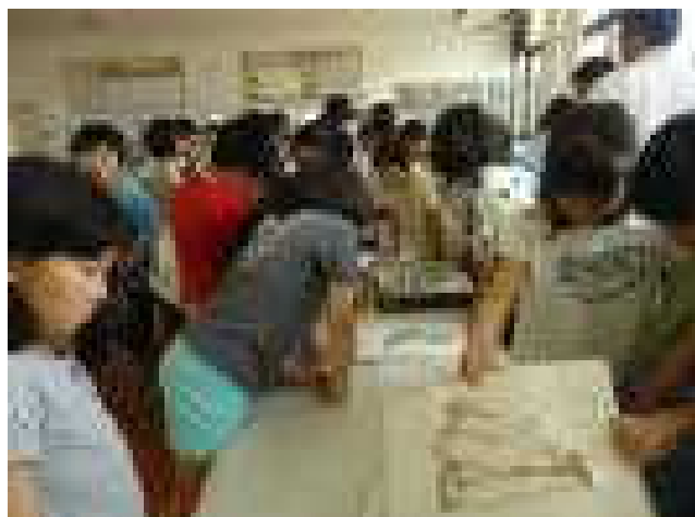
科学研究講習会（7月12日）「科学研究に挑戦！」 科学研究講習会（7月12日）「標本を作ろう！」

先日発生しました「平成30年7月豪雨(西日本豪雨)」では、死者が13府県で200人を超え、全・半壊した住宅が700戸を超えるなど、西日本各地に甚大な被害をもたらしました。亡くなられた方々に心からお悔やみを申し上げますとともに、被災された方々が日常生活を取り戻され、被災地域の一日も早い復旧を願ってやみません。