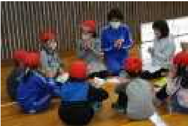
刈羽小学校では、清掃や運動会を異学年の子どもたちでつくるファミリー班で行っています。その顔合わせ会を行いました。(4月12日)

新しい先生・新しい友達を迎えて、平成30年度の学校生活が始まりました。総勢245名でのスタートです。