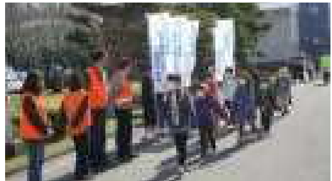
元気なあいさつが響いた「全村あいさつ運動の日」です。(4月13日)