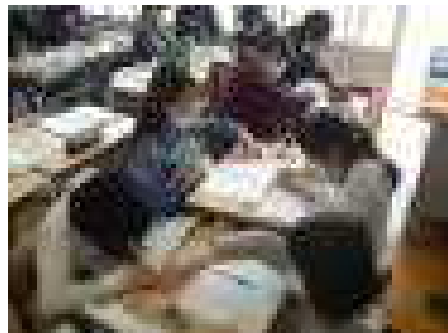
6年生は算数を教えあつて。

参観後は、PTA総会や学年懇談会を行い、30年度のPTA活動がスタートしました。本年度のPTA活動に対しまして御理解と御協力をお願いいたします。