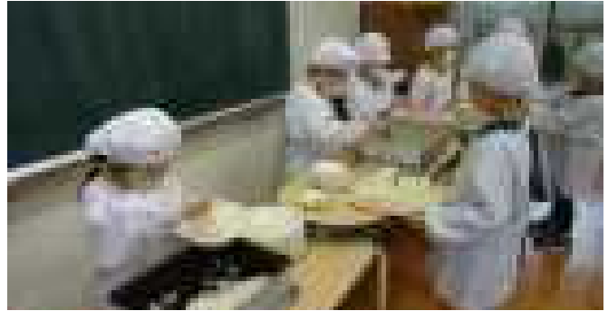
1年生の給食が始まりました。初めての給食はカレーライスでした。給食当番の仕事をがんばってやりました。(4月11日)

新しい先生・新しい友達を迎えて、平成30年度の学校生活が始まりました。総勢245名でのスタートです。