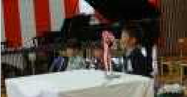
始業式で1学期のめあてを、原稿を見ないで発表しました。(4月6日)